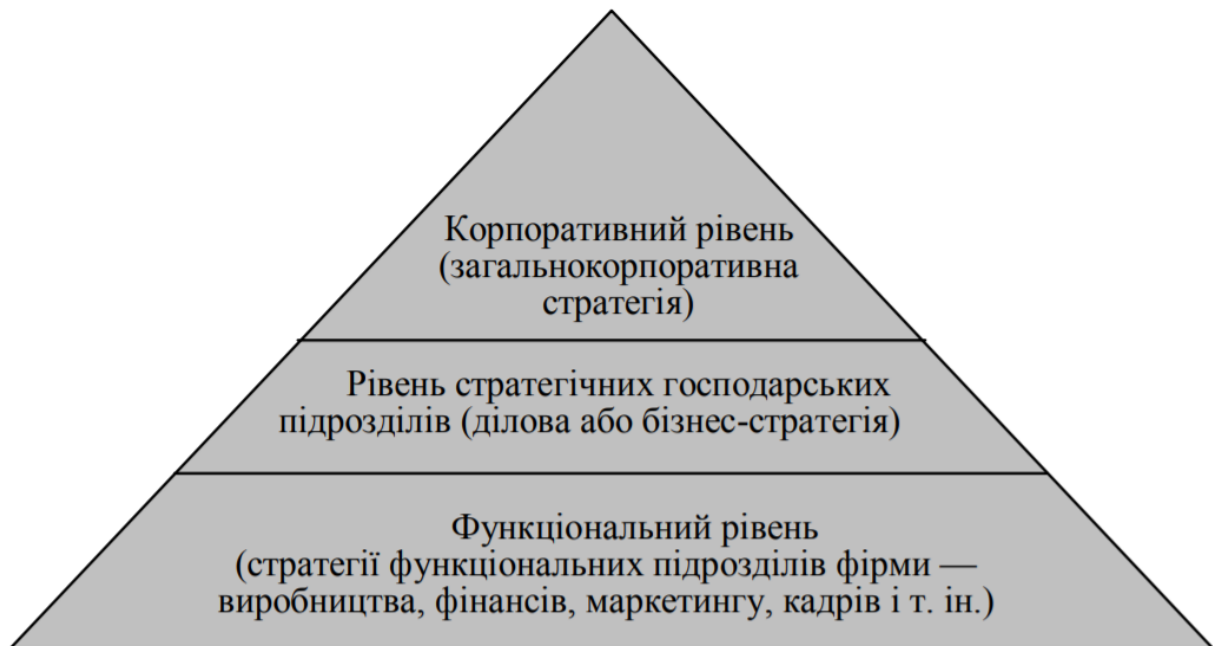
Рис. 2. Стратегічна піраміда *

В основі формування стратегічних альтернатив та вибору перспективних стратегій підприємства та його стратегічних бізнес одиниць має бути застосування матричного інструментарію. Сформований стратегічний портфель підприємства може бути представлений у формі піраміди стратегій (по А.А. Томпсону і Дж. Стрікленду) або у вигляді стратегічного куба. Тобто стратегія обирається у такому порядку: базова з визначенням з альтернативної, ділові (за умови декількох СБО), функціональна.