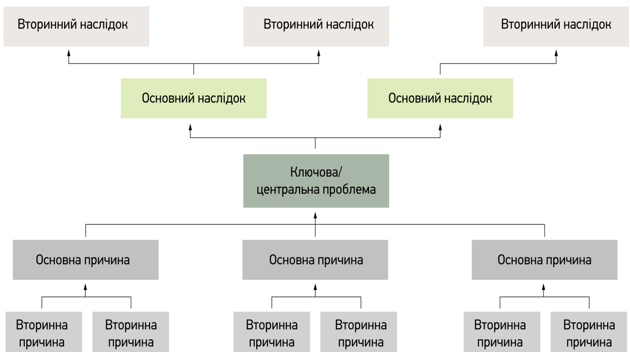
Рис. 1. Форма для побудови «Дерева проблем»

4. Далі слід провести декомпозицію генеральної проблеми і побудувати «дерево проблем» (особливо необхідно виділити проблеми підприємства, пов'язані з вирішенням завдань згідно вибраній темі КР).